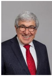
Mitteilung vom Stanley M. Bergman