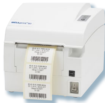
Ausdruck von Barcode-Etiketten mit dem MELAprint 60

Die Autoklaven der Evolution-Serie bieten vielseitige Möglichkeiten für die Dokumentation: angefangen bei der Netzwerk-Einbindung via Ethernet-Schnittstelle, über den Ausdruck von Barcode-Etiketten für die Kennzeichnung verpackter Instrumente bis zur Ausgabe der Protokolle auf die CF-Card.