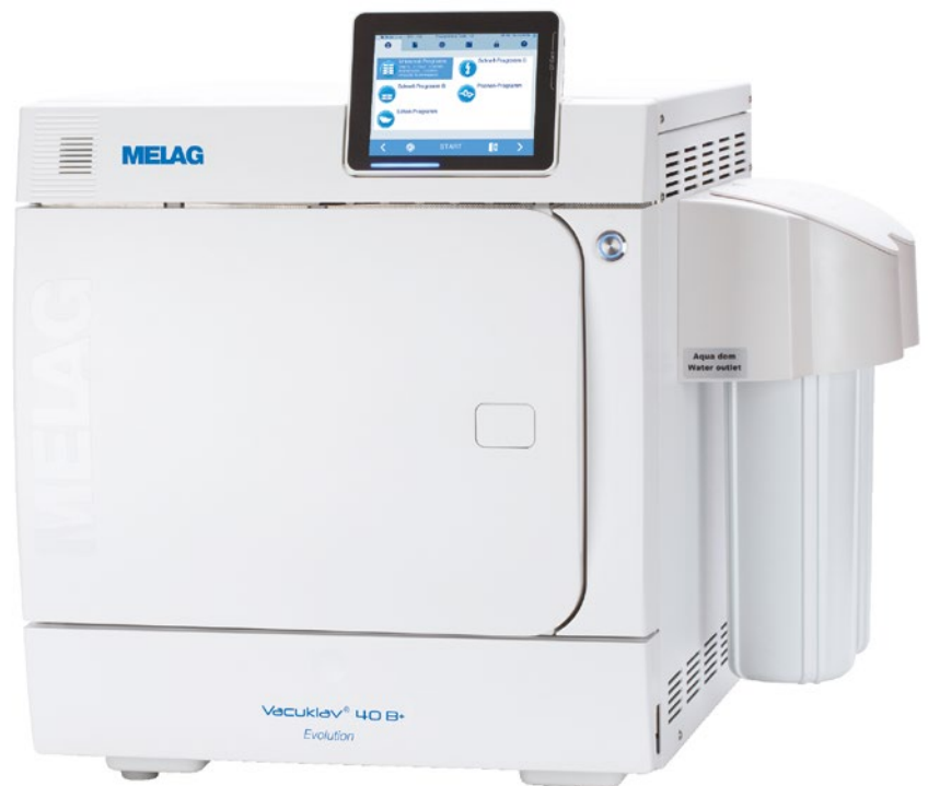
Vacuklav40B+ Evolution mit seitlich angebrachter MELAdem40

Sparen Sie Zeit und Geld, das Sie für das Beschaffen, Transportieren, Lagern und Einfüllen des destillierten oder demineralisierten Wassers in Ihren Autoklaven benötigen, indem Sie Ihren Vacuklav an eine Wasser-Aufbereitungsanlage anschließen. Wenn sich in der Nähe des Autoklaven ein Wasserzu- und Wasserablauf befindet, automatisieren Sie nicht nur die Befüllung und Dosierung, sondern auch den Abfluss des verwendeten Wassers. Von der kleinen praktischen MELAdem40 über die besonders wirtschaftliche und umweltfreundliche Umkehr-Osmose-Anlage MELAdem47 bis zur Hochleistungs-Anlage MELAdem53 (für den gleichzeitigen Anschluss eines Themodesinfektors) bieten wir hier für jeden gewünschten Einsatz die passende Lösung.