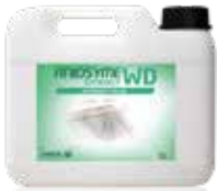
Aniosyme Synergy WD 5 Liter Kanister

Tri-Enzymatischer Flüssigreiniger für die maschinelle Instrumentenaufbereitung